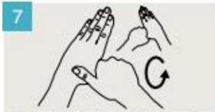
Rodeando el pulgar izquierdo con la palma de la mano derecha, fróteselo con un movimiento de rotación, y viceversa.