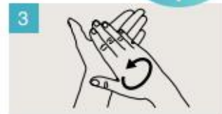
Frótese las palmas de las manos entre sí.