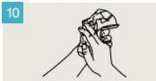
Séqueselas con una toalla de un solo uso.