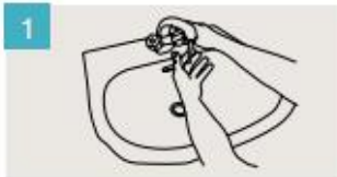
Mójese las manos.

DURACIÓN DEL LAVADO: entre 40/60 segundos