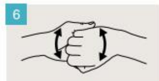
Frótese el dorso de los dedos de una mano contra la palma de la mano opuesta, manteniendo unidos los dedos.