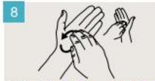
Frótese la punta de los dedos de la mano derecha contra la palma de la mano izquierda, haciendo un movimiento de rotación, y viceversa.