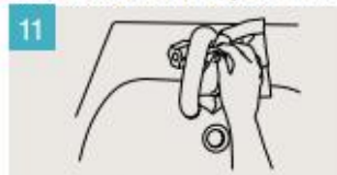
Utilice la toalla para cerrar el grifo.