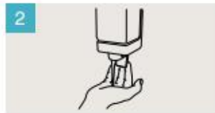
Aplique suficiente jabón para cubrir todas las superficies de las manos.