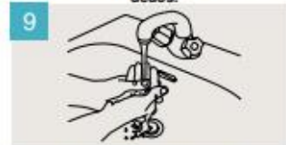
Enjuáguese las manos.