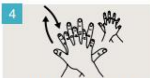
Frótese la palma de la mano derecha contra el dorso de la mano izquierda entrelazando los dedos, y viceversa.